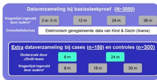
Figuur 1 Dataverzameling bij basissteekproef en cases

Om de evolutie van (kwetsbare) kinderen en gezinnen en de impact van bedreigende en beschermende factoren beter in kaart te brengen, wordt een subgroep van kinderen en ouders intensiever opgevolgd door middel van tussentijdse bevestigingen en contactmomenten, met o.a. een interview van de moeder en een multidisciplinair onderzoek van het kind door het JOnG!-team op de leeftijd van 8 en 24 maanden (figuur 1). Op dit ogenblik doen 330 gezinnen mee aan deze verdiepinggroep, waarvan de rekrutering tot eind januari 2010 verder loopt.